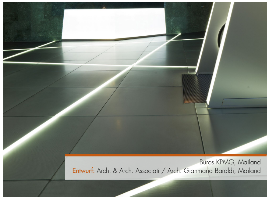
Entwurf: Arch. & Arch. Associati / Arch. Gianmaria Baraldi, Mailand Büros KPMG, Mailand

In den Fotografien wiedergegebene Farben und Finishes können leicht von den tatsächlichen Farben und Finishes abweichen: wir empfehlen die Auswahl direkt am Muster.