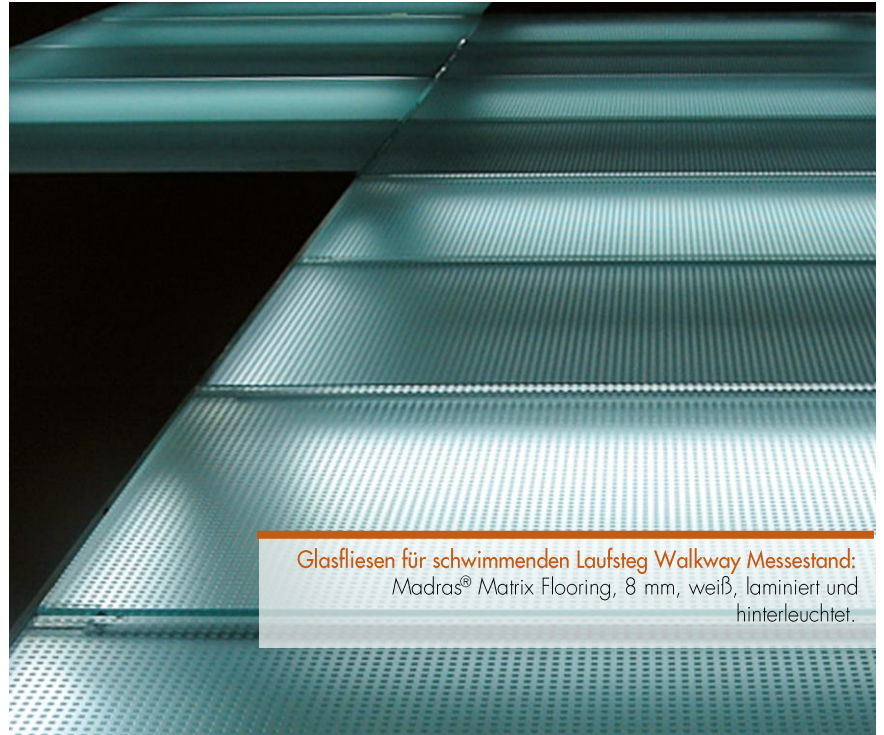
Glasfliesen für schwimmenden Laufsteg Walkway Messestand: Madras® Matrix Flooring, 8 mm, weiß, laminiert und hinterleuchtet.